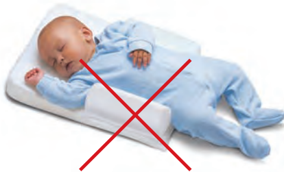
Posicionadores para dormir