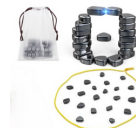
Auncley Magnetic Chess Games (Ingestion)